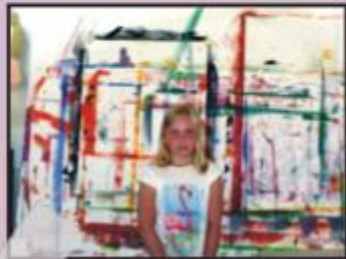
Kunst Im Atelier