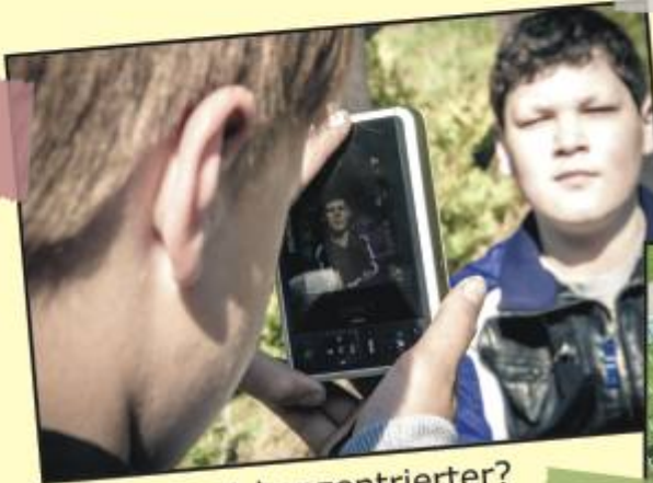
Wer schaut konzentrierter?