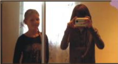
Wir sehen einander