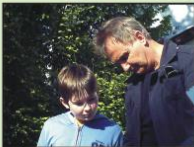
Die Profis am Tüfteln