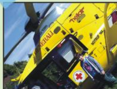
Piloten ist nichts verboten