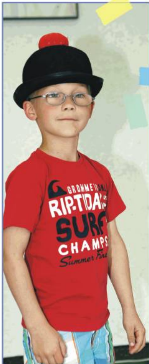
Die kleine Melone

Und die Hutkreationen mussten sich vor jenen, welche wir von der alljährlichen Hutmodeschau in Ascot kennen, nicht verstecken. Vom Stofftierhut bis zum Lampedusahut, von der Knopfkappe bis zur kleinen Melone, jede einzelne Kreation waren wirklich vom Feinsten.