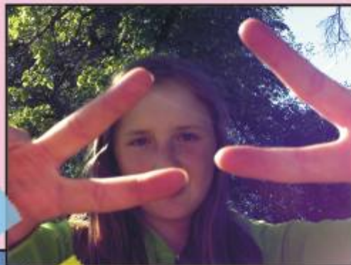
Ich sehe Dich