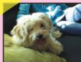
Wem gehört der kleine Fuchur?