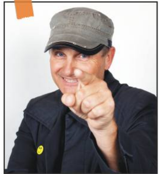
Mag. Gert Steinhäler Berufsfotograf

Ich bin leidenschaftlicher Berufsfotograf und Professor am Centrum Humanberuflicher Schulen des Bundes in Villach im Bereich Kommunikation und Mediendesign mit den Schwerpunkten Fotografie, 3D-Modelling, Animation, Webdesign und Grundlagen der IT.