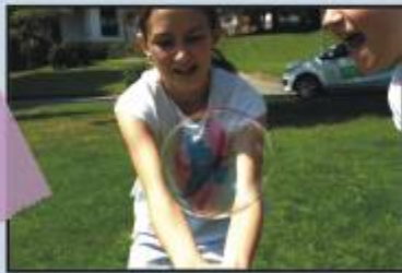
Seifenblasen-Volleyball 3 Kulleraugen