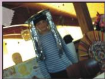
Mann trägt wieder Hut