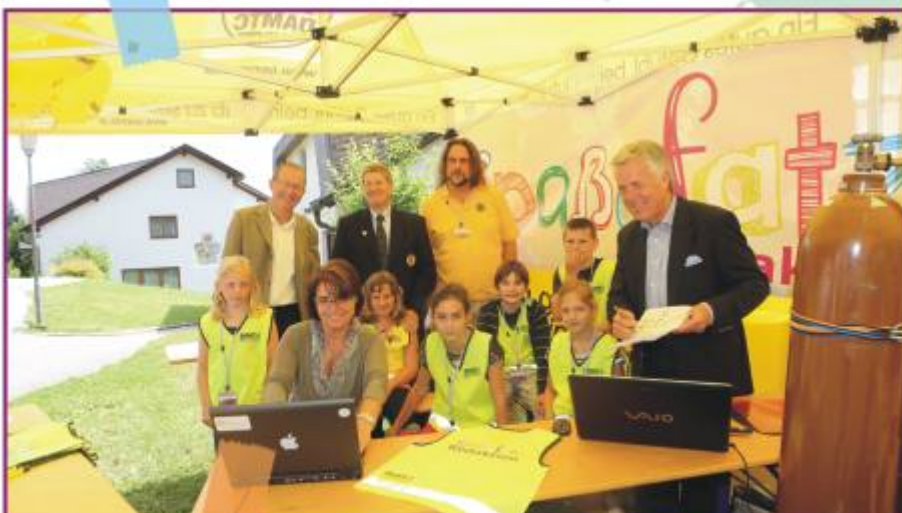
Die Redaktion rockt

Stärkung gab es beim „Saftladen“ und bei den vielen Labestationen im gesamten Dorf. Ja, das Leben der Spaßofatz-Fest-Redaktion war sehr, sehr, sehr anstrengend heute!! :-)