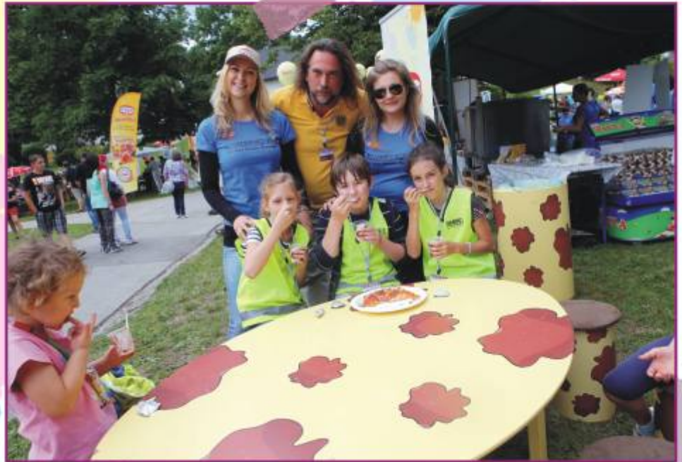
Die Redaktion braucht Stärkung