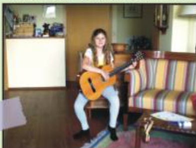
The next Christl Stürmer?