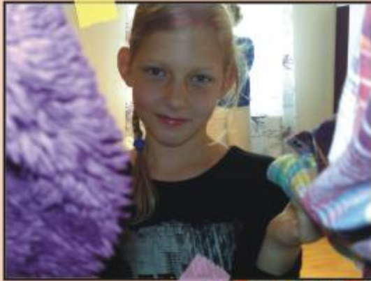
Dies da oder das da ?