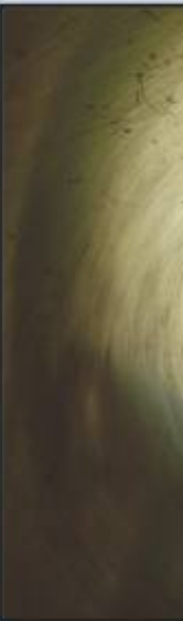
durch diese hohle Gasse..