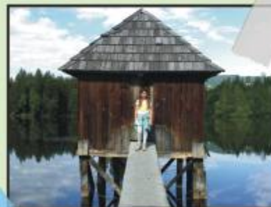
„Mein“ Haus am See