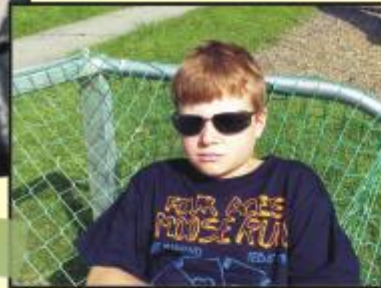
Der Herrscher des Torraumes