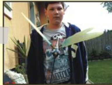
Die Libelle fliegt